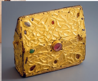
Eucharistiekästchen. Vergoldetes Kupferblech auf Holzkern. 8. Jh. Domschatzmuseum Chur.