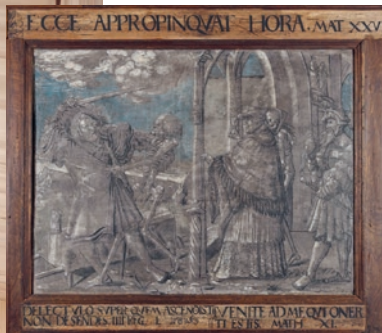
Churer Todesbilder, 1543. Szenen Graf und Domherr. Domschatzmuseum Chur.